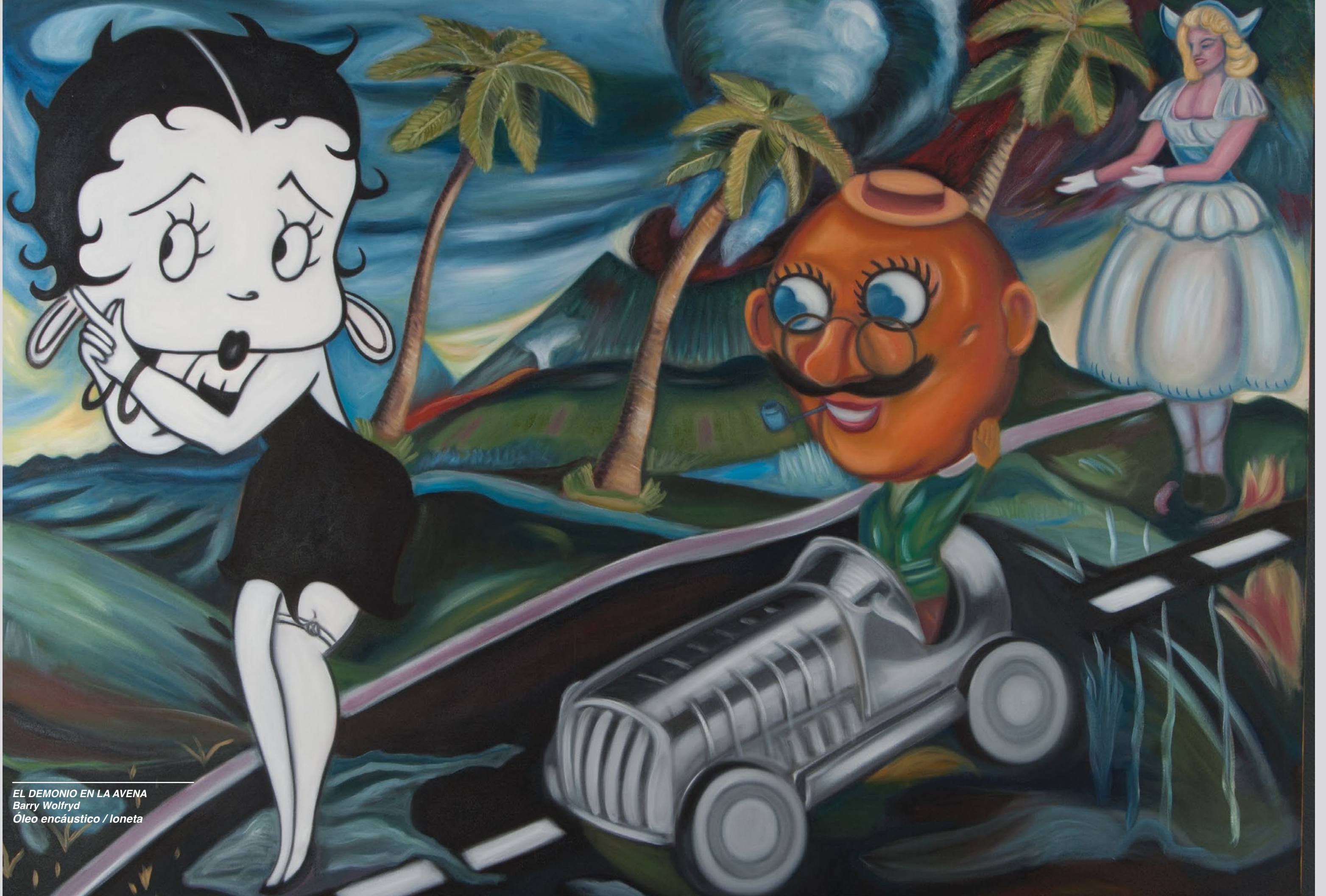
EL DEMONIO EN LA AVENA Barry Wolfryd Óleo encáustico / loneta