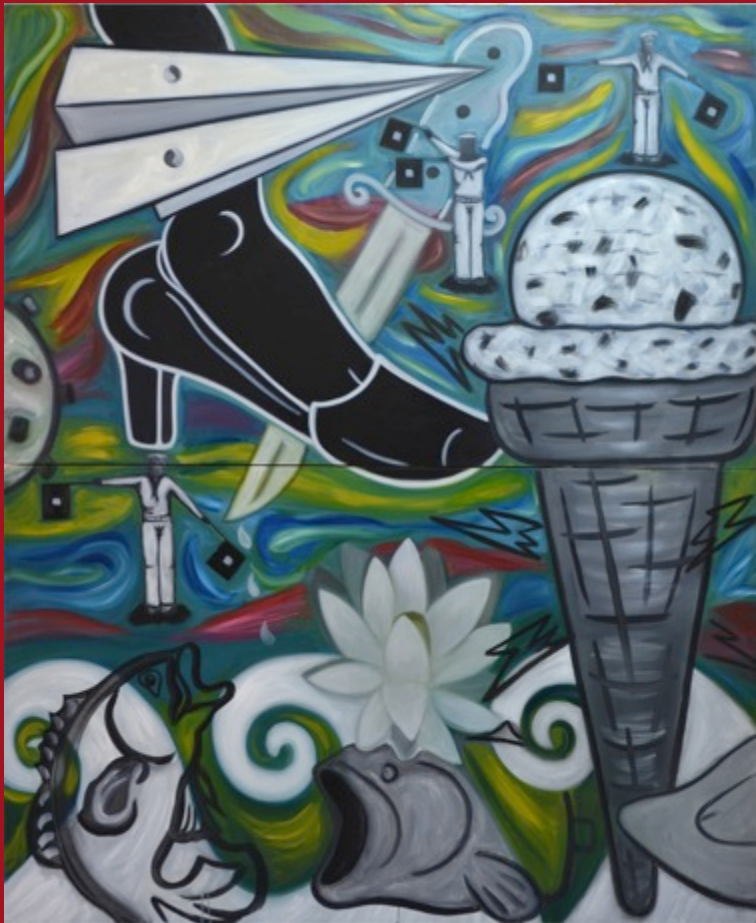
Salvación Salvation 172 x 140 cm Óleo, encausto sobre loneta Oil, Encaustic on Canvas 2015