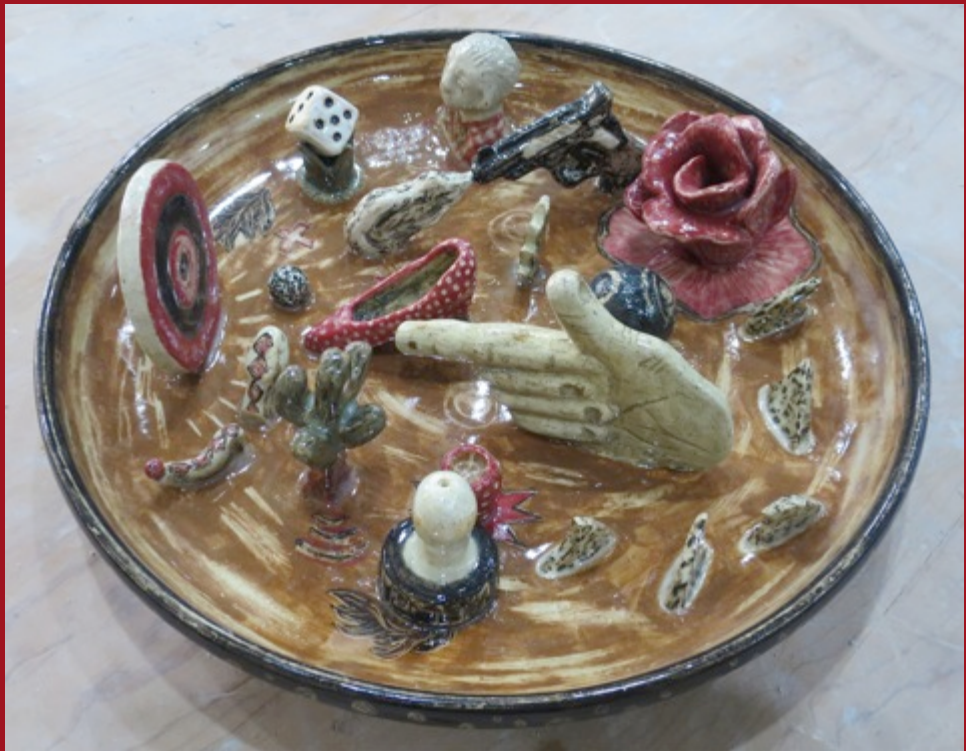
Sobre El Blanco On Target 40 x 40 x 16 cm Cerámica de Alta Temperatura Stoneware 2015