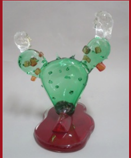
Charco y Nopal Mutantes Mutant Nopal and Puddle 41 x 36 x 37 cm. Vidrio Murano Murano Glass 2014