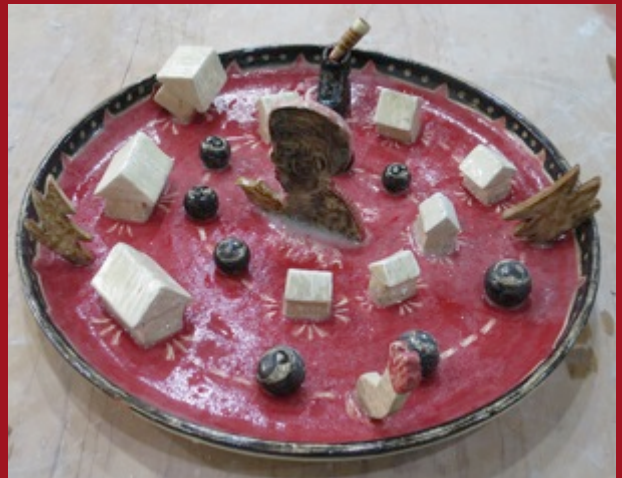
Advertencia II Warning II 37x 37 x 15 cm. Ceramica de Alta Temperatura Stoneware 2015