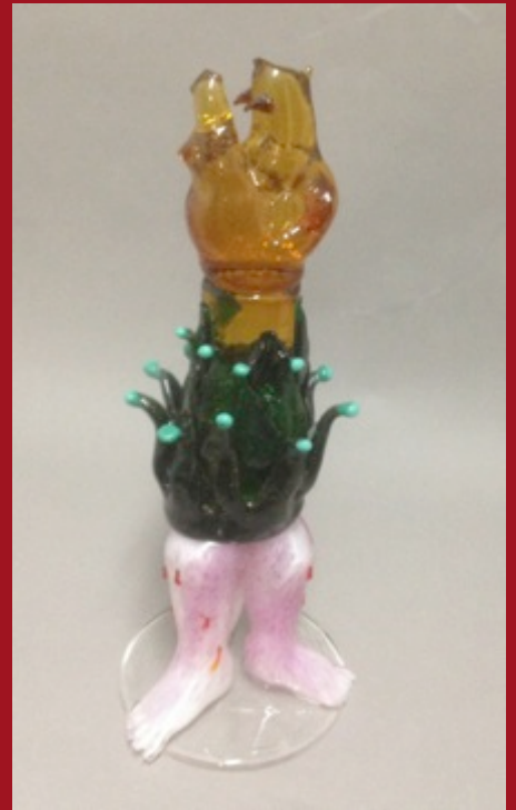
Pasos de Los Dioses Steps of The Gods 47 x 25 x 25 cm Vidrio Murano Murano Glass 2014