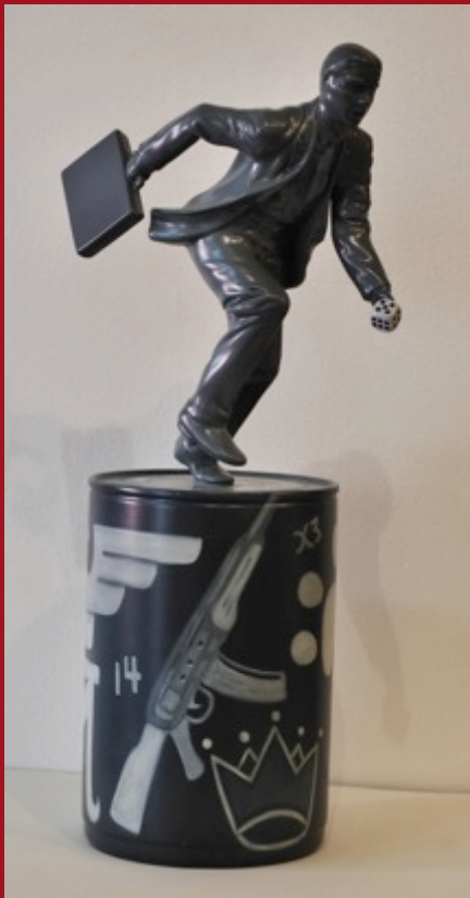
Hombre Apostando Suerte Man Betting on Luck 55 x 19 x 28 cm Cerámica mixta, Ceramic and mix media 2013