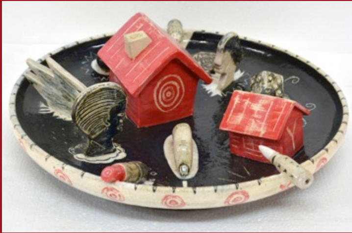
Casa grande, casa chica, Big house, little house 40 x 40 x 16 cm. Cerámica de Alta Temperatura Stoneware 2014