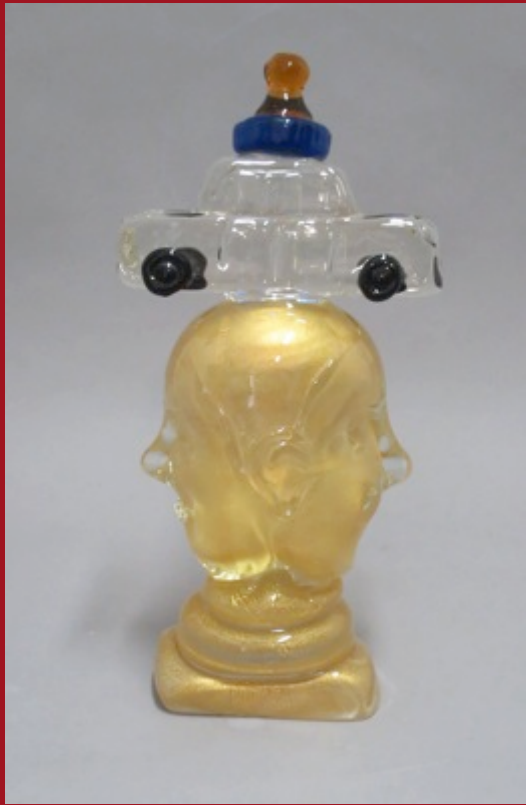
Lecciones Lessons 43 x 21 x 15 cm. Vidrio Murano Murano Glass 2014