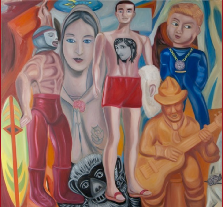
Los Muñecos The Dolls 140 x 150 cm Óleo, encausto sobre loneta Oil, encaustic on canvas 2013