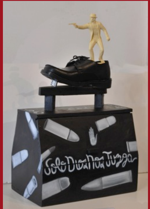
El Migrante The Emigrant 50 x 30 x 18 cm. Madera con tecnica mixta Wood and mix media 2011