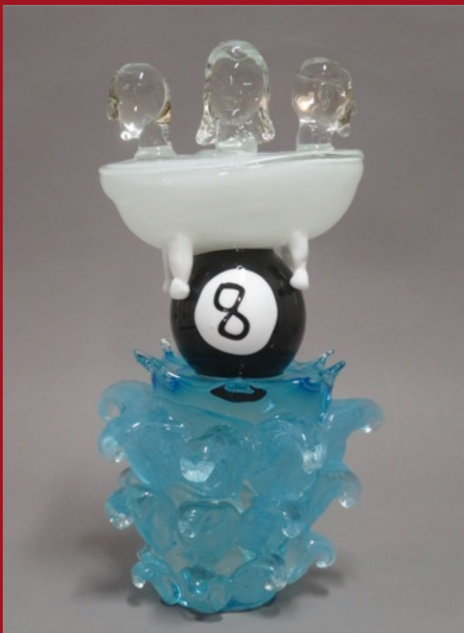
Alta Marea High Tide 47 x 24 x 25 cm. Vidrio Murano Murano Glass 2014