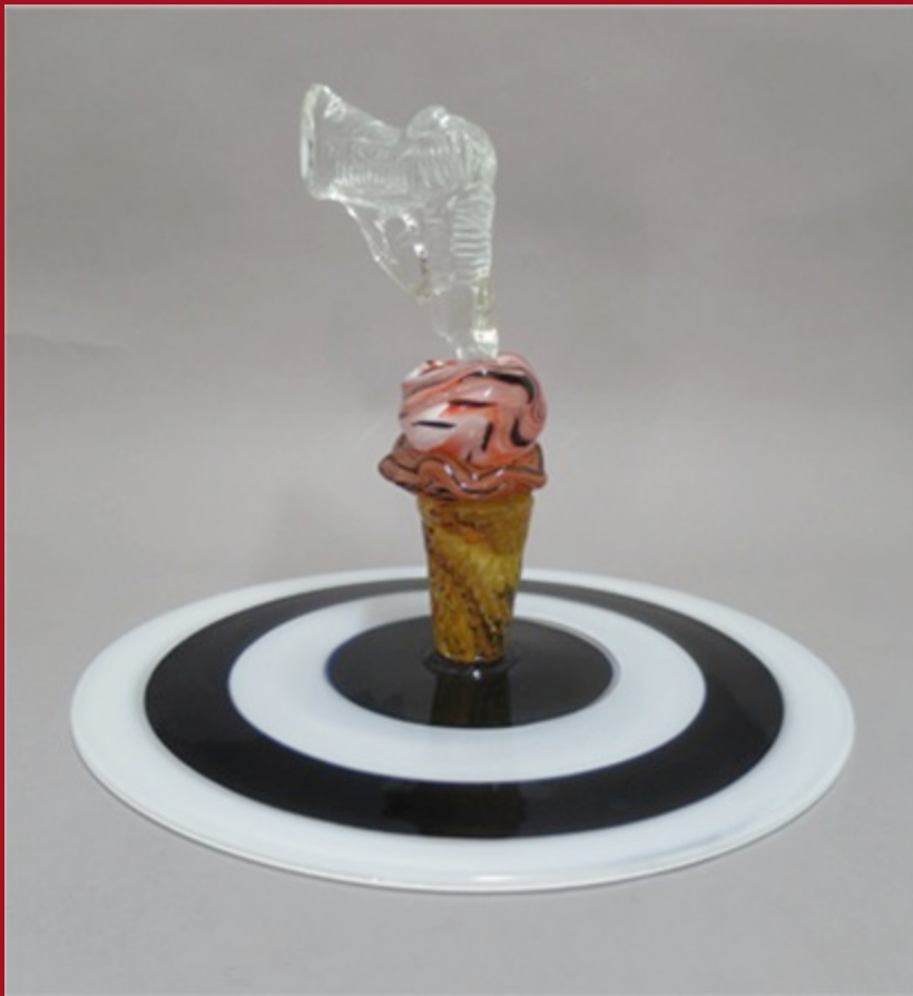
El Blanco The Target 33 x 45 x 45 cm. Vidrio Murano Murano Glass 2014