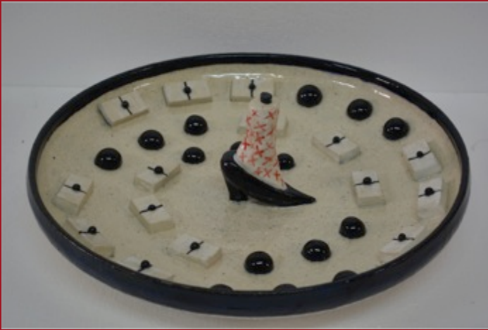
Advertencia I Warning I 37x 37 x 15 cm. Ceramica de Alta Temperatura Stoneware 2014