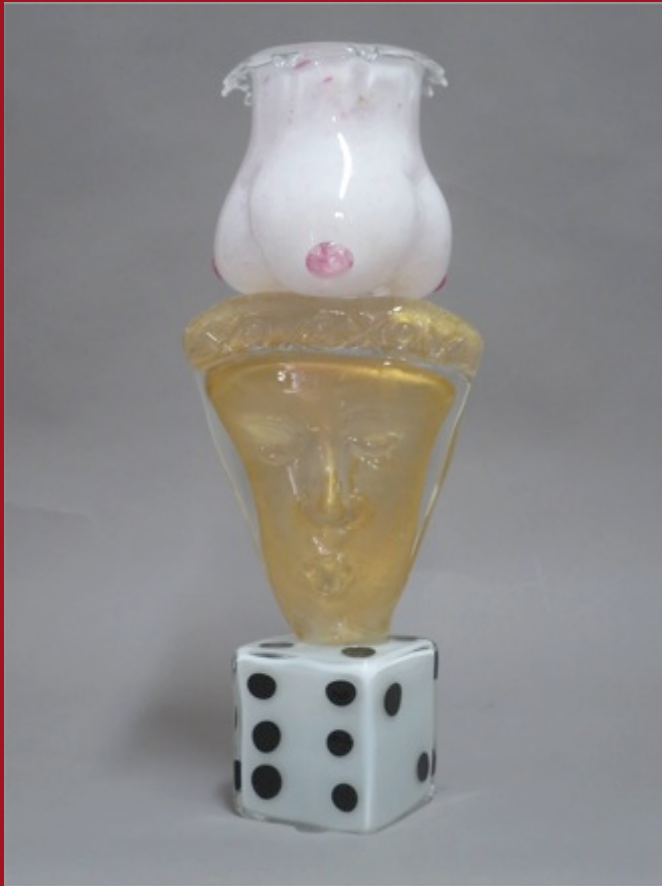
Nivel de Consciencia Conscience Level 55x 22x 19 cm. Vidrio Murano Murano Glass 2014